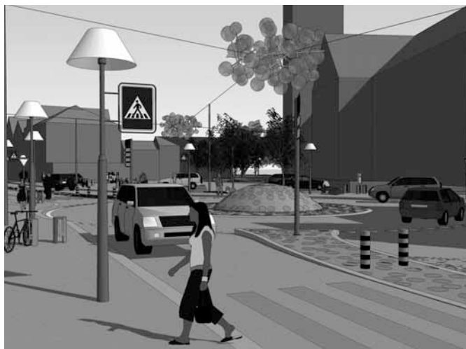
Futuristische Gestaltung mit Wohn-Atmosphäre am Andreasplatz

Fussgängerstreifen bleiben vorerst bestehen. Es ist aber denkbar, dass in einigen Jahren auch auf einer Kantonsstrasse Tempo 30 signalisiert werden kann und somit dannzumal auf die Zebrastreifen verzichtet werden kann. Die Fussgänger geniessen dann beim Ueberqueren der Strasse überall Vortritt.