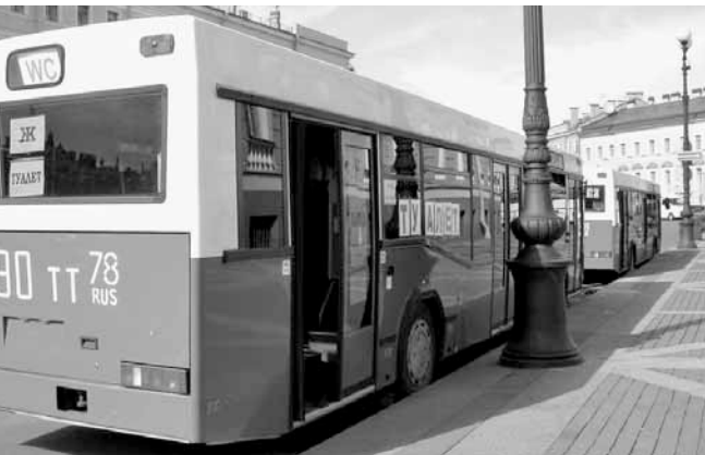
Revolutionäres in St.Petersburg: Alte Busse werden als WC in Gebrauch genommen.

Neben den regelmässigen Fussballspielen im Stadion gäbe es noch eine Reihe weiterer Anlässe auf Stadtgebiet, wo so ein Gefährt beim Publikum sicher hochwillkommen wäre. Zumindest für die Umsetzung dieser innovativen Idee bräuchten die VBSG nicht privatisiert zu werden.