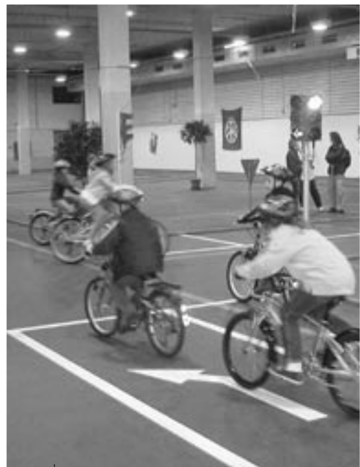
Üben im Verkehrsgarten in der OLMA-Halle.

In diesem Jahr bieten wir erstmals Veloseminare in Gossau und St.Gallen für Erwachsene, Kurse mit Schwerpunkt «Velo und Kreisel» in Gossau und Standardkurse neu in Goldach und voraussichtlich Herisau an. Kursflyer mit Anmeldetalon können bei der VCS Geschäftsstelle (Tel. 071 222 26 32, E-mail: vcs.sg@bluewin.ch) bestellt werden.