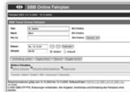
Online schon verfügbar: Der neue Fahrplan 2005

müssen die S-Bahn ein paar Minuten früher benutzen (Flawil ab 6.56, Montag-Freitag).