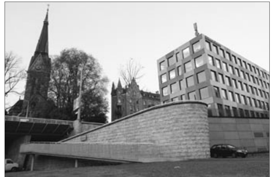
Die neue Velorampe bei der Leonhardsbrücke

VCS St.Gallen/Appenzell Postfach /Marktgasse 4 9004 St.Gallen Tel. 071 222 26 32 oder: r.wick@schweiz.org