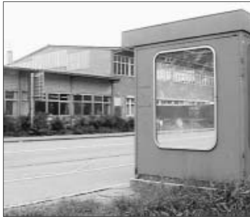
Haltestelle Wiesenbach, Abtwil