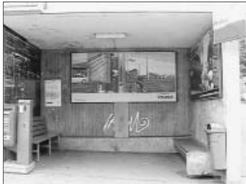
Haltestelle Waldau, Zürcherstrasse