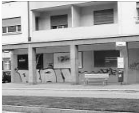
Haltestelle Lachen, Zürcherstrasse