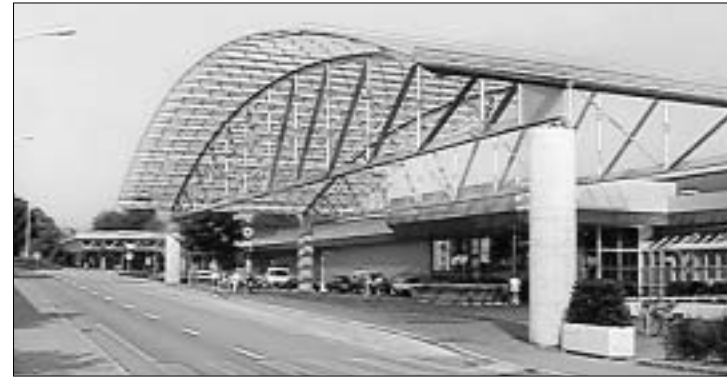
← Busbahnhof Gallusmarkt