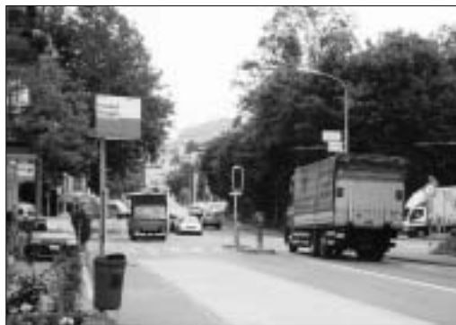
Haltestelle Friedhof Bruggen