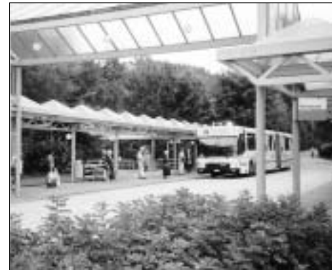
↑ Haltestelle Säntispark