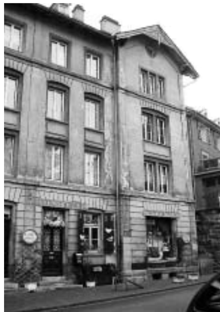
Liegenschaft Wassergasse 9 und 11

Was wir wollen, entspricht zu 100% den Ideen des Stadtrates, die er im April 1999 dem Gemeindeparlament vorlegte. Dieses Konzept ist durchdacht und auch heute noch sachgerecht.