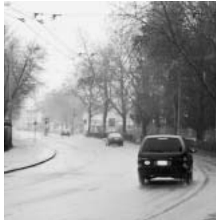
Zürcherstrasse: Tempo 50; breite Strasse mit wenig FussgängerInnen