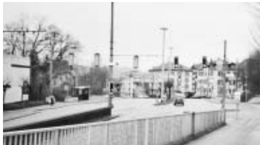
KV-Schulhaus: Tempo 30; Ampeln ersetzen durch Kreisel, FussgängerInnenübergang für KV-SchülerInnen

wie die Strassen für alle nach der Abstimmung aussehen (könnten)