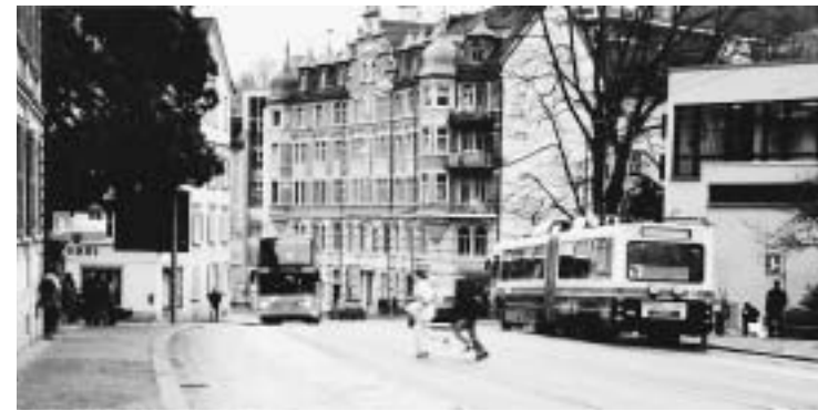
Rorschacherstrasse: Tempo 30; Viele SchülerInnen der Kanti, Musikschule, Spelterini