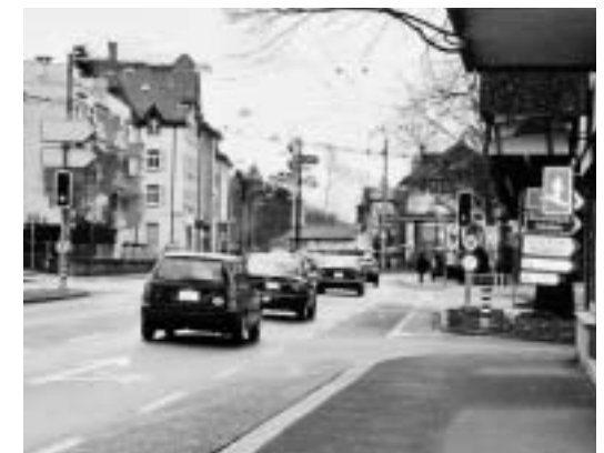
Stephanshorn (links) und Heiligkreuz, Richtung Kronbühl (oben): Tempo 50; keine Gefahrenzone