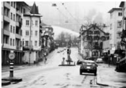
Zentrum Lachen: Tempo 30; viele Läden und Post mit vielen FussgängerInnen