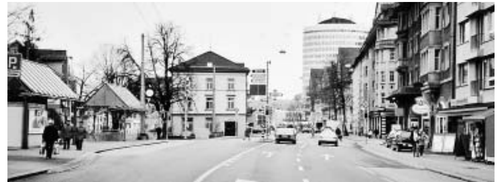
St. Fiden: Tempo 30; Viele Geschäfte, Kirche, Verkehrsberuhigung mit Kreisel