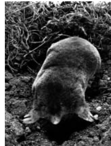
Maulwurf und Bohrkopf; sich durch den Boden graben bedarf einer ähnlichen Form. Die Technik hat der Natur oft abgeschaut.