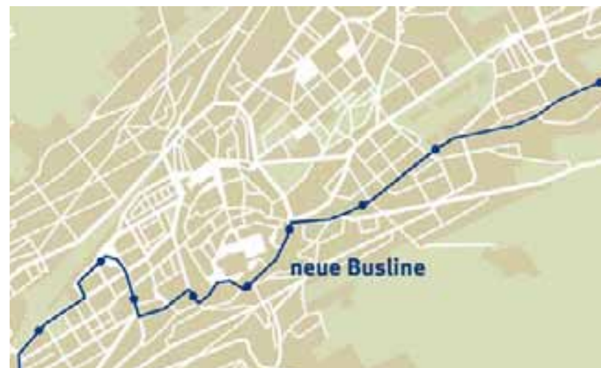
Verlauf der neuen Buslinie durch die Altstadt Vorgeschlagene Linienverknüpfung der Buslinie 2: Haggen – Bahnhof – südliche Altstadt – Flurhof – Neudorf