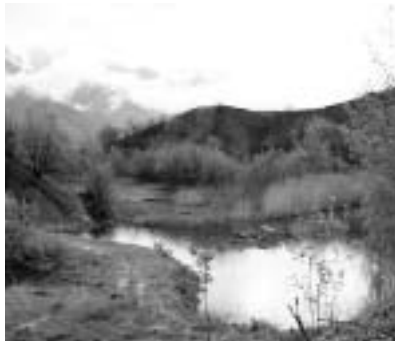
Im Jahr 2001 werteten wir das Gebiet mit verschiedenen Massnahmen auf: neue Tümpel, Schaffung offener Flächen mit Ruderalflora...

Gegen diese Schmälerung eines seltenen Lebensraumes wehrten wir uns 1997 mit einer Einsprache und viel Öffentlichkeitsarbeit. Mit Erfolg: 1999 hat die St. Galler Regierung die Bucht als Wasser- und Zugvogelgebiet von nationaler Bedeutung bezeichnet und dafür Vorschriften in der kommunalen Schutzverordnung verlangt. Darauf hin hat der Gemeinderat sein Aufschüttungsprojekt zurückgezogen.