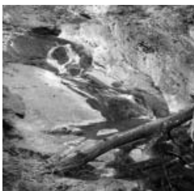
Dank Pro Natura weiterhin ein Fischgewässer: der Gstaldenbach unterhalb Heiden.

Ohne das Verbandsbeschwerderecht wäre nicht nur ein Teil des national bedeutenden Schutzgebietes zerstört worden, es wäre auch nie die Frage geklärt worden, was unter «geschützter Ufervegetation» zu verstehen ist und wie das Natur- und Heimatschutzgesetz interpretiert werden muss. Der Bundesgerichtsentscheid hat erst die Grundlage für weitere Behördenentscheide in dieser Frage geschaffen.