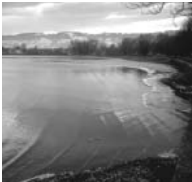
Die Wasservögel danken mit einem regen Besuch der Schlickflächen.