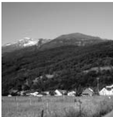
Unser neuester Erfolg: erst das Bundesgericht entschied zu Gunsten der Natur.

Pro Natura setzte sich daher seit 1982 für den Erhalt der Kiesgrube Feerbach ein. Unsere Einsprache gegen das Deponieprojekt führte nach einem langen Kampf zum Ergebnis, dass der Regierungsrat 1995 das Gebiet unter Schutz stellte. Heute haben wir die Kiesgrube gepachtet und so die Verantwortung für das Schutzgebiet übernommen.