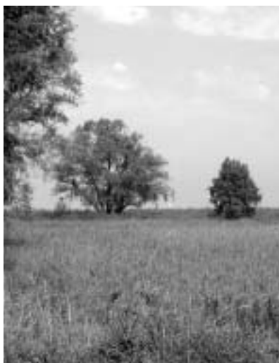
Überbauung oder national bedeutendes Flachmoor?