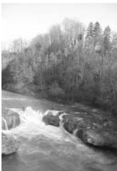
Der Wasserfall bei Felsegg.

wirtschaftsfreundliche Regierungsrat des Kantons Appenzell Ausserrhoden unterstützte diese Forderung und wies 1996 unsere Einsprache ab. Gegen diesen offensichtlich bundesrechtswidrigen Entscheid hatten wir beim Verwaltungsgericht Einsprache erhoben. Dieses kam zum gleichen Schluss wie wir: Beim Gstaldenbach handelt es sich um ein Fischgewässer und die Restwassermenge muss im Minimum 50 l/s betragen.